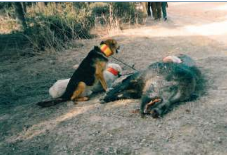
Buen cochino cobrado por los perros de Rehalas el Lince, con dos perros heridos. Pero entregó el chaleco.