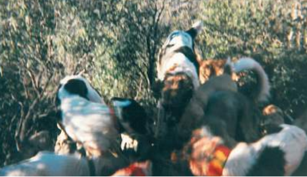
Cariñoso y juguetón con los niños y temible en los agarres... Así era el León .