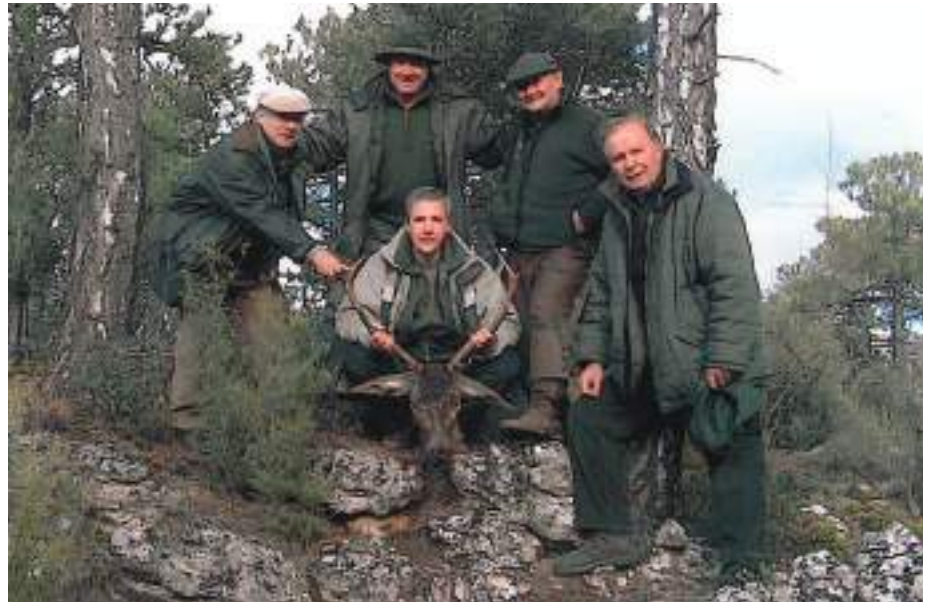
En la página anterior, arriba, con el Sultán , un todo terreno en la menor y la mayor. Sobre estas líneas, el Gorí , Paco , Lince , el Capi y, con el venado, el Gacela , quien remató el venado que fue pinchado por todos.

Me considero más ecologista que muchos de los que presumen de serlo. Por mi trabajo, haciendo depuradoras tanto de residuales como de potables, depuradoras