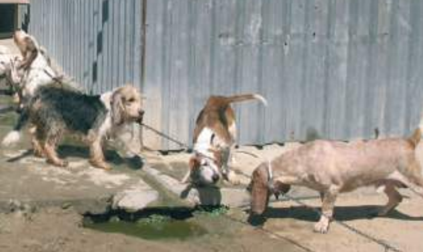
En el sentido de las agujas del reloj: Perros de rastro (busca); cachorros cruce de grifón, sabueso y beagle; cachorros cruce de podenco grifón y mastín; y con unos lebreles: cruce de mastina y galgo.